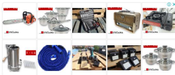
Auto Dizalica 3 Tone Stečajna.Hr

Grad Dubrovnik isplatio subvencije za podstanarstvo za 228 korisnika mjere